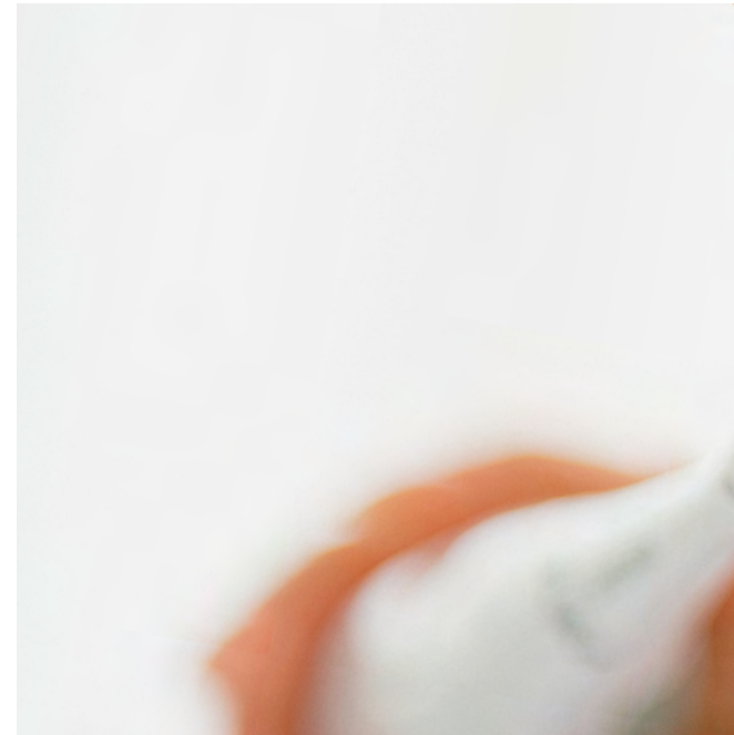
Elektrische Zahnbürste: Beim Zähne putzen das Zahnfleisch